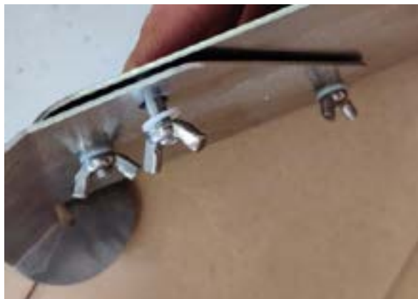
Den Sackhalter aufsetzen, die Kunststoff-Scheiben auffädeln und mit den Flügelmuttern sichern.