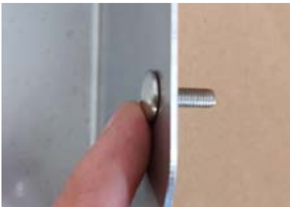
Die Torbandschrauben (je 3x) von der Innenseite des Trichters nach außen stecken.

Der Sackhalter kann auf alle Sortiertische Sortier! montiert werden. Beim Sortier! 02 ist eine werkzeuglose Montage möglich, da Torbandschrauben und Flügelmuttern verwendet werden.