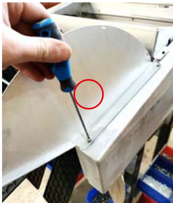
Abbildung 2: Schrauben Sie nun an der linken Seite das Seitenteil des Nuss-Schildes wie abgebildet mit den eben gelösten Schrauben an (die Schrauben müssen außen sein).