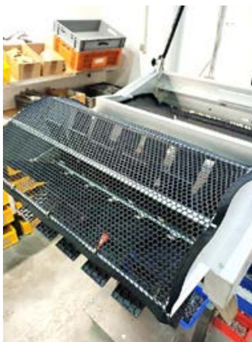
Abbildung 4: Hängen Sie nun das Netz in die 2 \times 4 Stifte der Querstreben ein. Auch in die Häkchen der ersten und letzten Querstrebe muss das Netz eingehängt werden.

Abbildung 5: Das Netz muss mit einer leichten Spannung eingehängt werden. Am besten bei der vordersten Querstrebe beginnen und nach hinten arbeiten.